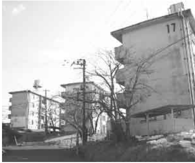
▲暴力団員の入居が禁止となる市営住宅

しかし、少子高齢化が進めば現役世代の負担が増加せざるを得ない。制度改革に痛みを伴うのは事実だが、よりよい制度を作り上げていくために、市として、広域連合とともに着実に準備を進め、市町村の立場から現実的な議論を積み上げるべきである。