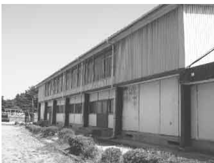
▲不二が丘小学校体育館

の指定からもはずさなければならぬ。早期建設が必要だ。 市長 国庫負担等に関する法の基準で算定すると約一千平方メートルとなり、市内の他の学校施設と同規模となる。教育的利用や社会教育的利用に耐えうる施設となる。できるだけ早期に整備するよう取り組んでいきたい。