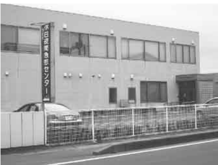
▲休日夜間急患センター

所長 十二月から翌年三月までは、土曜日の午後六時から九時まで、岩沼市内の医師に協力してもらい、小児科の診察をしている。