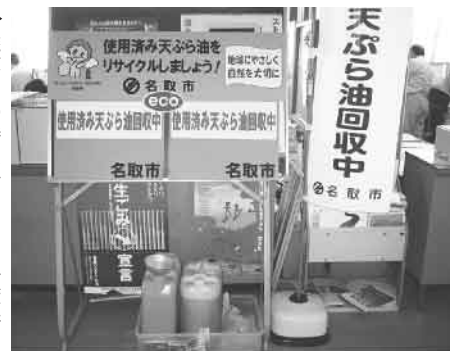
▶ 廃食用油を常時回収・クリーン対策

議員 家庭用使用済天ぷら油の回収事業の現状と効果は。市長 これまでの回収総量は約千二百リットルで当初の見込みには至っていないが、家庭から取り組む身近な環境活動として徐々に理解され始めている。 議員 さらに利便性を図るため、商店や事業所等に回収協力店として依頼を推進してはどうか。市長 家庭から出る一般廃棄物である廃食用油を資源物として、指定した社会福祉法人に収集してもらおう方法で理解してもらっている。回収の効率も大事である。 議員 身近な取り組みからマイバック運動と同時に「マイ箸運動」を推進してはどうか。市長 名取市ごみ減量等推進協議会において「マイ箸運動」も「マイバック運動同様、実践して