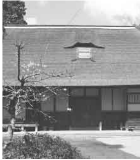
▲重要文化財河口家住宅

委員 委託料の内容について。 課長 表門、馬屋の茅葺屋根の葺き替え、及び堀といくね整備に向けた基本設計を行う。