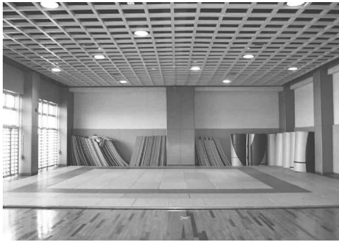
名取市民体育館武道場

議員 改正教育基本法を受け、伝統と文化」を継承発展させ、公共の精神」を尊ぶ日本人の育成を掲げ、保健体育の中に中学校で武道を必修化すると示しているが、本市の取り組みはどうか。教育長 市としてはそのねらいに沿った教育活動が出来るよう学校に対する支援、環境整備を進めるべきと考えている。しかし、女子の種目はどうするか、安全面も含めて保健体育教員はしっかり指導できるのか等、教育現場では問題になると思う。また選択科目によっては用具、装備に経費もかかるので保護者