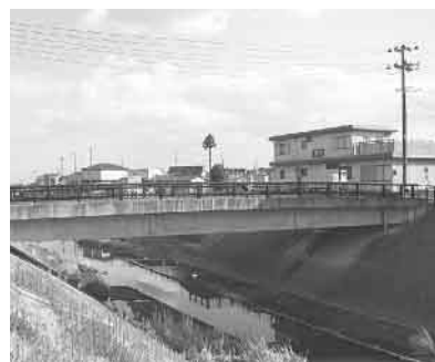
▲点検が行われる市道橋