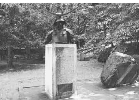
▲ 初代の伊達政宗公胸像