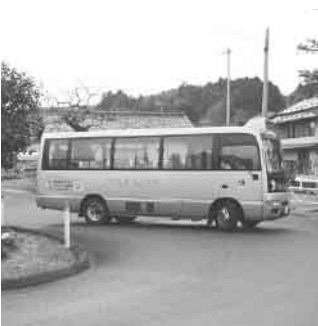
▲ 公用車となるげんきなとり号

十九年度より廃食油の回収を始めた。地域特性にあった農作物をバイオマス資源として活用することとは、農産物の多目的利用の可能性や、環境問題の解決策となる。しかし、農作物や材木を利用したバイオ燃料は、課題もあるので今後も研究していきたい。