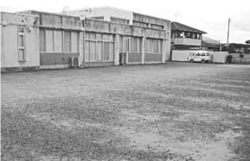
▲舗装が待たれる愛島公民館駐車場

施設の整備については、地域住民や利用者からの意見を聞きながら、より利用しやすい公民館にするため常設ステージの整備を含めて検討していく。トイレの改修についてもバリアフリーを図りながら順次整備をしていく。駐車場の舗装については地域からも要望があり、現地も確認している。必要性についても十分認識しているので、今後市長部局とよく相談して、前向きに推進していく。