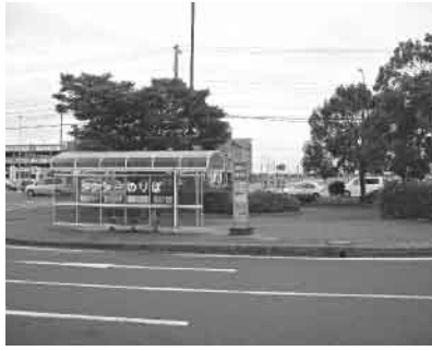
▲館腰駅タクシープール

委員 駅前広場内タクシープールの一般車利用はできないのか。 課長 タクシープールは、タクシー会社に有料で貸している。一般車両の利用は考えていない。