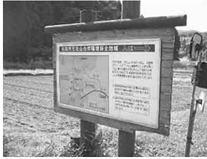
▲五社山自然観察路入口

議員 本市の発注工事を見た時その殆んどが指名競争入札を執行しており、市長の裁量によるところが大きいと判断される。本来なら、市内の経済活性化、雇用機会の拡大といった観点から、公共事業に、地元企業(市の助成を受けて行う民間事業も含む。)を活用すべきでないか。あるいは、活用されるように努力すべきでないかと考える。