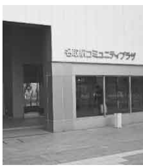
▲コミュニティプラザ

課長 条例ではプラザホールのみ料金が規定されている。それ以外について有料にする考えはない。