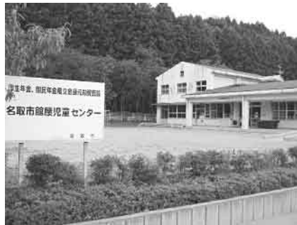
▲館腰児童センター(植松三丁目)

各議員の一般質問の内、一項目を掲載いたしました。なお、掲載項目以外の一般質問については、その他の一般質問として、項目のみ掲載しております。