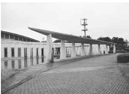
▲名取市斎場(小塚原字新鍋島)

きと考えるがどうか。池の配置は、水の持つ癒しの心を演出する効果が大きい。水の入れ替えをせず、清掃の回数も減らすことは好ましい管理とは考えられないがどうか。市長 屋根の高さや通路については建築意匠の問題があり、市が直接改善することは難しいが、設計者と相談したい。池については、年二回清掃を行っているが、ひび割れがあり新しい水を張ると漏水する。砂地盤であることや池の構造体の