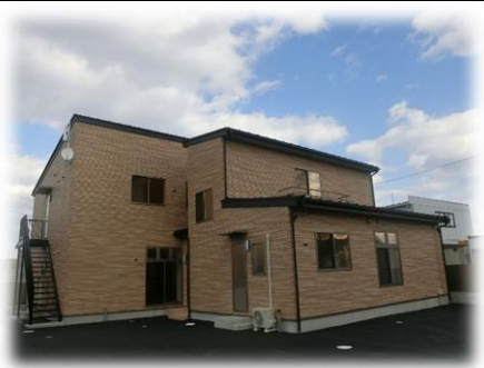
ショートステイは写真の1階部分になります