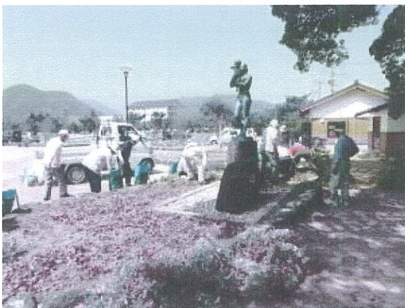
◇平成26年 中央公園 市民花壇 春の苗植

○「寄附による花と緑の推進」については、萩市の花と緑の推進を応援する個人及び法人その他の団体等から寄附金及び樹木等の寄附を募ることが出来るとしている。 ○「花と緑の銀行の設置」については、寄附を受けた樹木等を植栽場所が決定するまでの間保管する。受け入れた樹木等を適正に管理又は育成し、活用のための必要な処置を行うものとするとしている。