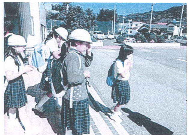
別れが辛くて泣いている子どももたくさんいました。

・平成21年2校226名埼玉県松山女子高他 ・平成22年2校199名 農山漁村PJ14名他 ・平成23年20校3129名 中10高9大1校 ・平成24年24校4168名大阪東京愛知奈良 ・平成25年18校2438名 小中校で18校 ・平成26年20校2982名 小中校で20校 修学旅行の費用は宿泊費(1泊2食)@7000円、稼業体験2000円で協議会とエージェント費用が含まれる。