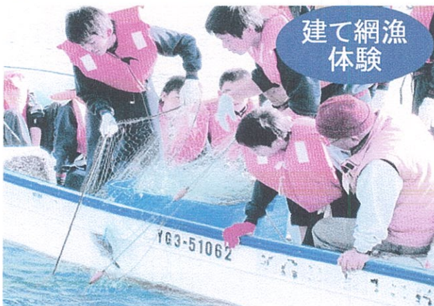
網を入れる体験をした後、前日に仕掛けた別の網を引き上げる。獲れた魚で調理体験。

現在、約70体験プログラムがある。主なプログラムは地引網漁体験、建て網体験、石臼引き体験、郷土料理作り体験、石風呂体験、武者絵染色体験、カヌー体験など整備した