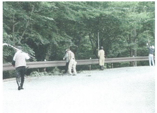
◇萩市大字椿東(桜花台)桜の剪定

登録メンバーに対する専門知識のアドバイザーには、花と緑の協議会より講師の派遣がなされる。(元農業高校教諭・元JA職員・森林組合OB等)また、公道沿線、河川などにおいて、花の種子や苗木、肥料などの資材提供、公共用地の花木などの管理する活動に対し専門家の派遣や、器具の貸し出しなど支援体制を整えている。(登録している団体は7団体、個人は4人合計人数141名)