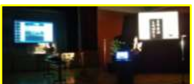
影絵鑑賞している新宮市様の様子をホールスクリーンに投影。