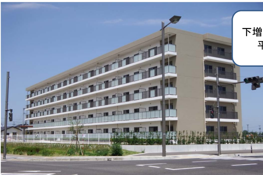
下増田地区災害公営住宅 平成27年7月撮影