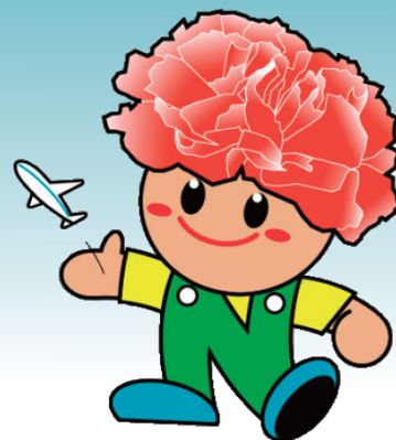
名取市キャラクター 「カーチくん」