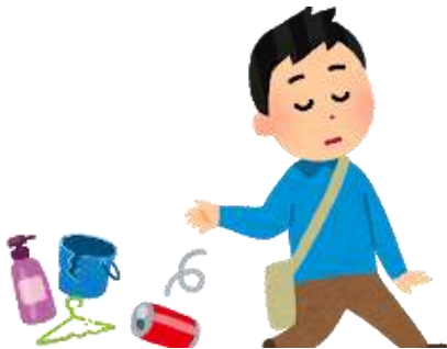
街中でごみをポイ捨て

★適正処理されないプラスチックごみが、風雨により河川に入り、海へ流出。海岸の汚染や海洋生物に悪影響を及ぼすなど、環境衛生上大きな問題となっています。