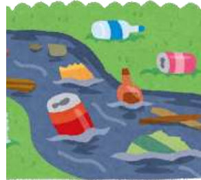
ごみが風に飛ばされて河川へ