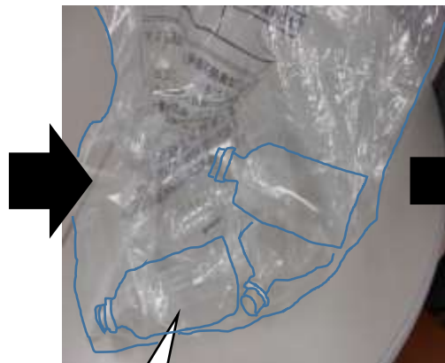
④ ペットボトルはペットボトルとしてリサイクル資源袋へ