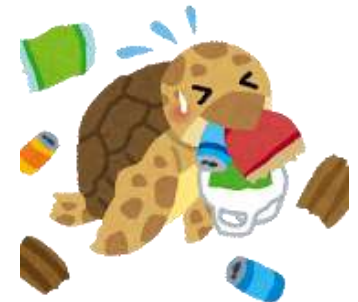
海洋生物が体内に取り込む