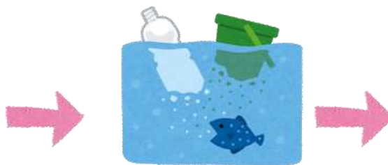
海へ流出（マイクロプラスチック化）