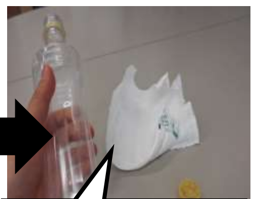
③ ラベルをはがす (変更点)