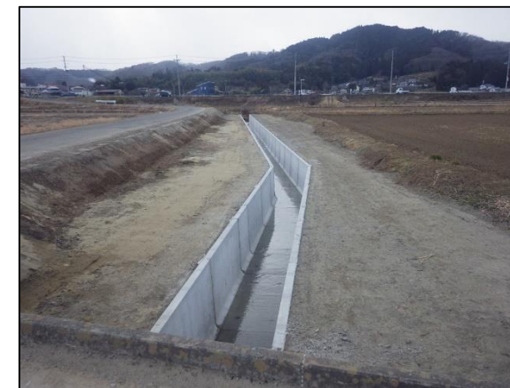
イメージ(R3年度施工箇所 上施工前・下施工後)