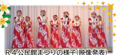
R4公民館まつりの様子(映像発表)