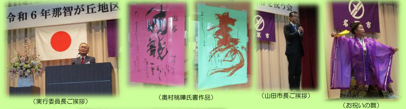
(実行委員長ご挨拶)

令和6年1月6日土曜日、4年ぶりとなる「新春を祝う会」が開催されました。70名余りの皆様にお出向きいただき、新年を彩るにふさわしいお祝いの舞、大黒舞、安来節、スコップ三味線、カラオケ、ハワイアンフラ等、アトラクションとご歓談で楽しいひと時を過ごしていただきました。十二支の中で唯一、空想の生き物である龍(辰)は、天に昇る様子から、中国では古来より成功や発展の象徴として、縁起がよいとされているそうです。さて、皆様の2024年は如何な年となることでしょうか。乞うご期待を…。