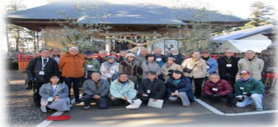
参加者集合写真（熊野那智神社）

1月10日みどり台中学校区連携事業として「仙台伝統門松見学」移動研修が開催されました。これは、かつて仙台北城や城下町で飾られていた「仙台伝統門松」をゆりが丘公民館、相互台公民館、那智が丘公民館でそれぞれ復元活動にたずさわっている方々を中心に、お互いの交流を目的に開催されたものです。門松制作の苦労話や工夫したところなどを話し合い、移動研修は盛り上がりしました。