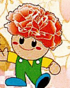
名取市マスコットキャラクター「カーナくん」