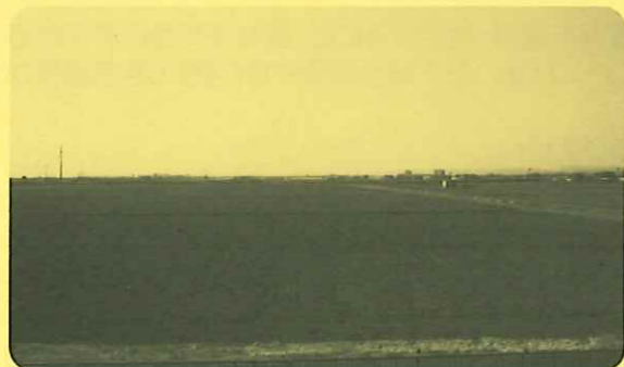
東部分区・関上字新狐島付近

また、当該地区を含んだ耕作証明書の記載内容は、農家台帳の更新完了までの間、換地処分前の内容となります。なお、当該地区の申請受付再開時期は、更新作業が完了次第、市ホームページでお知らせいたします。