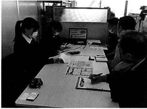
ちえぶくろ JKの知恵袋2