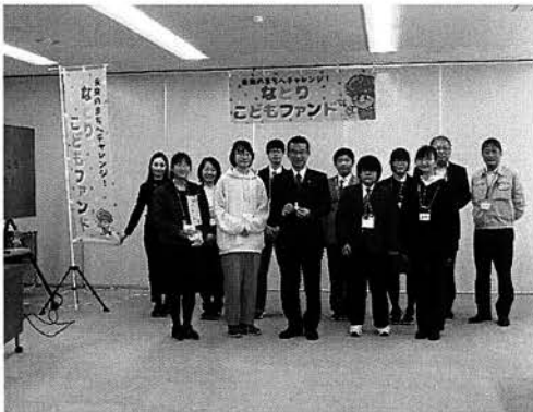
コミュニケーション ワールド Communication World