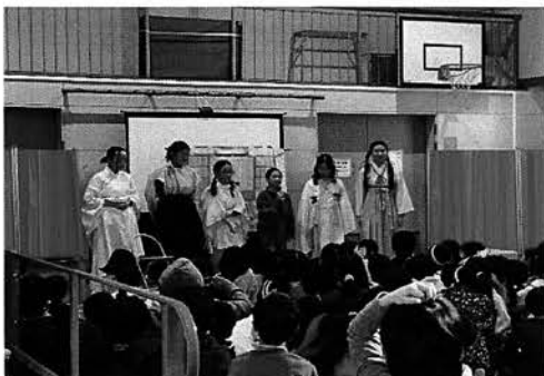
なとりろうじよ 名取老女をひろめたい