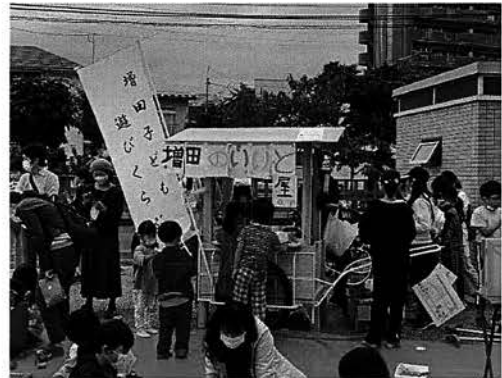
ますだこ あそび 増田子ども遊びクラブ