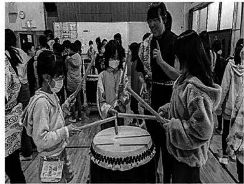
みやぎけんのうぎょうこうとうがっこう わだいこぶ 宮城県農業高等学校 和太鼓部