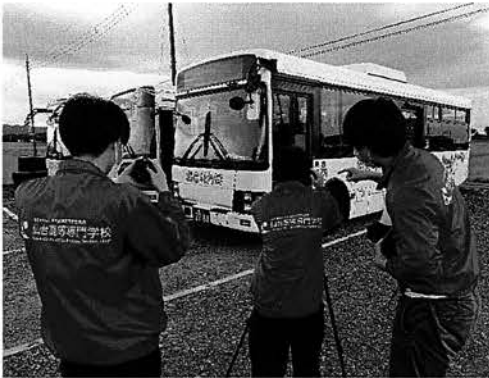
せんだいこうせん なとりし どうがせいさく 仙台高専 名取市PR動画製作プロジェクト