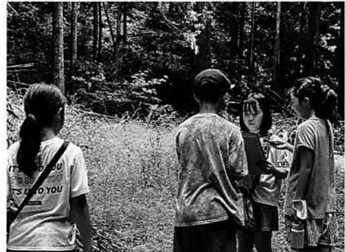
こほうそうきよく なちっ子放送局