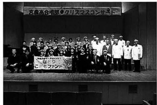
みやぎけんのうぎょうこうとうがっこう がっしょうぶ 宮城県農業高等学校 合唱部