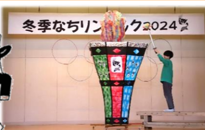
見事な聖火台と「7輪」！