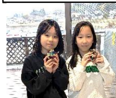
上手に作品が できました♡

春休み、小中学生が地域のサークル活動を体験！ギター、卓球、手芸、吹矢、ダンスなど初めての体験に子どもたちは本気で挑戦です。