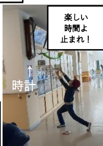
楽しい 時間よ 止まれ！

また、特別企画としてドローン操縦体験とモルック大会も開催しました。 ご協力頂いたサークル・愛好会の皆さま、ありがとうございました。