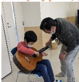
憧れのギター♪ カッコイイ！