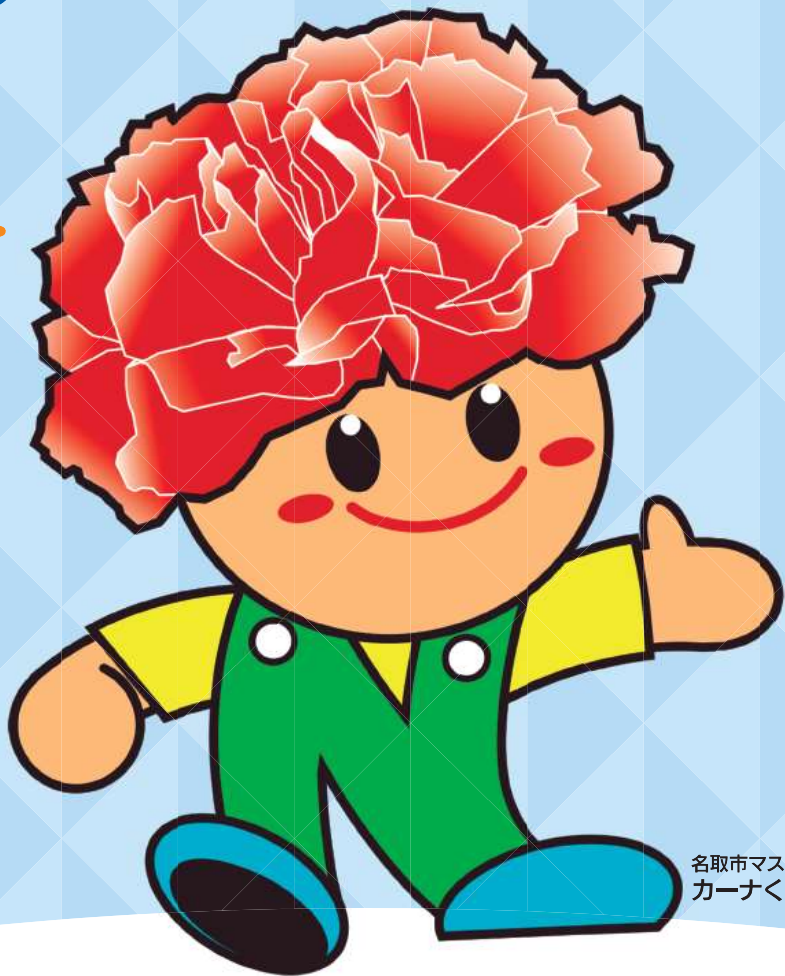
名取市マスコットキャラクター カーナくん