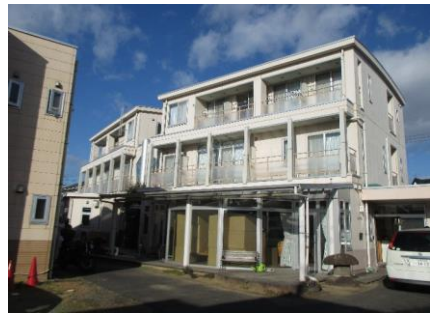
ショートステイは写真の2階部分になります