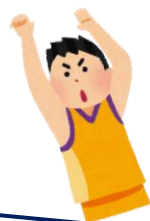
《バスケフリースロー》

《ストラックアウト》 集中してトライしてみよ う！パーフェクトを出す と特別賞(?)がもらえ るかも... ★