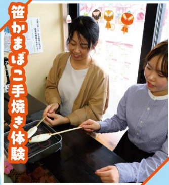
笹かまぼこ手焼き体験