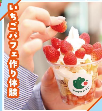
いちごパフェ作り体験