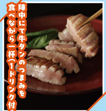
陣中にて牛タンのつまみを 食べながら一杯(1ドリンク付き)