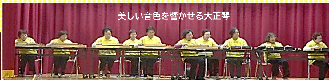
美しい音色を響かせる大正琴