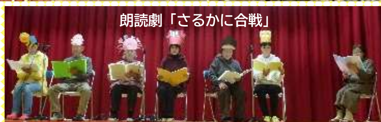
朗読劇「さるかに合戦」