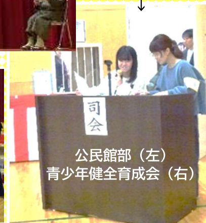
公民館部(左) 青少年健全育成会(右)

新年の業務は 貸館は1月5日(日)から 窓口は1月6日(月)から 開始します。 令和7年も当館をどうぞよろしくお願ひいたします。