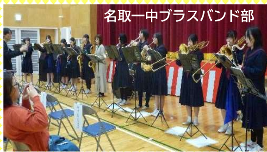
名取一中ブラスバンド部