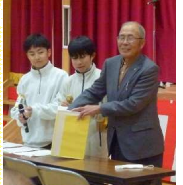
↑公民館部男子、大活躍！