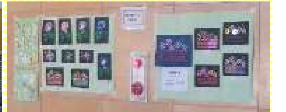
愛小・名取一中・愛島児童センターの生徒さんの作品