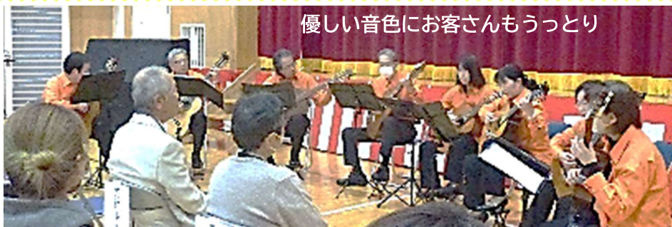
優しい音色にお客さんもうっとり