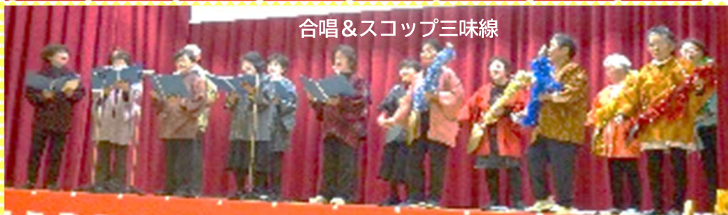
合唱&スコップ三味線