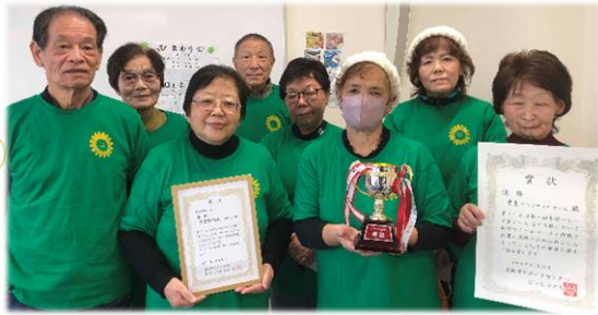
卓球バレー・第3回エリアカップ宮城大会 及び第3回卓球バレー大会 どっと.なとり杯