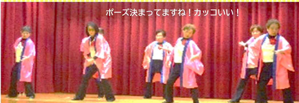
ポーズ決まってますね! カッコいい!