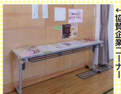
←協賛企業コーナー