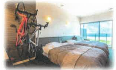
客室イメージ「ツイン(1~2名様)」