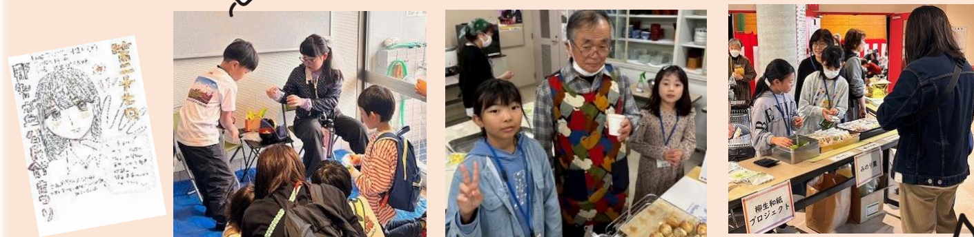
サークル販売・体験コーナー