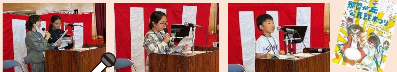
子どもたちによる司会・販売

また、今年は新たな取り組みとして、サークルの皆さんや地域の方による販売コーナーを設け、手作りの品が並びました。さらに、那智小協働本部との連携事業として子どもたちが司会や販売を担当し、元気いっぱいに活躍する姿がみられました。公民館まつりのポスターもみどり台中学校美術部の生徒に作成してもらい、まつりを盛り上げてくれました。子どもから大人まで、幅広い世代の方々が一緒に楽しみ、地域のつながりを感じられる一日となりました。ご来場いただきました皆さま、ご協力いただいた皆さま、誠にありがとうございました。