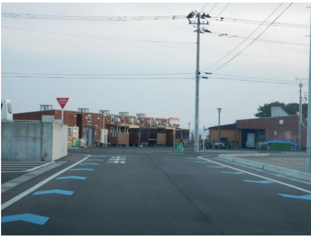
※矢羽根のイメージ

・令和7年度に全体設計を行い、具体的な着手の優先順位等を決定し、令和8年度から令和12年度にかけて順次整備を行っていく。