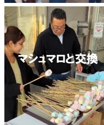
マシュマロと交換