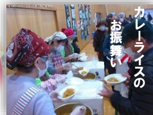
カレーライスの お振舞い