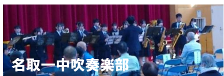
名取一中吹奏楽部