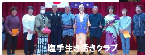
塩手生き活きクラブ