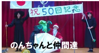
のんちゃん仲間達