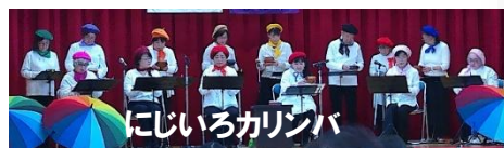
にじいろカリンバ