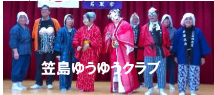
笠島ゆうゆうクラブ