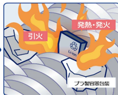
リサイクル工場での火災発生メカニズム