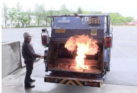
ごみ収集車で火災が発生した場合の再現映像

左の写真の製品はリチウムイオン電池が使われている電子機器の例となります。 これらを廃棄するときは 「有害・危険ごみ」のコンテナ に入れてください。