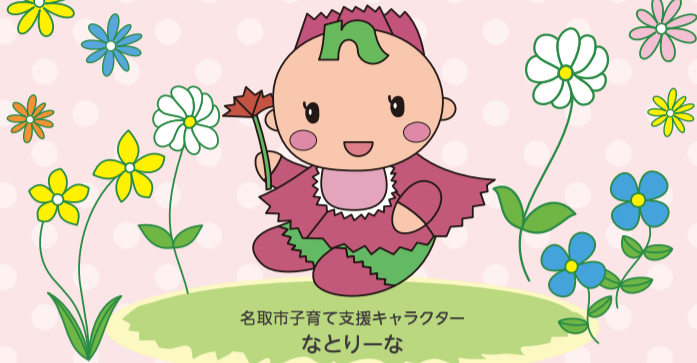
名取市子育て支援キャラクター なとりーな