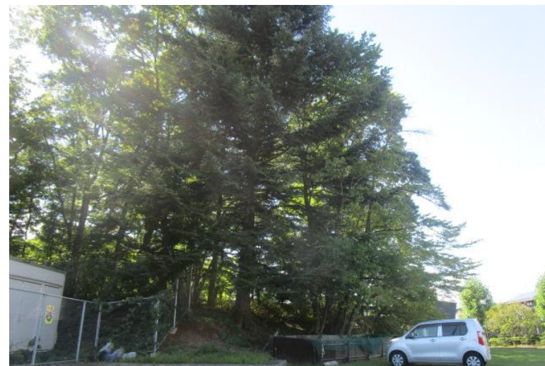
相互台公民館 南側の雑木林