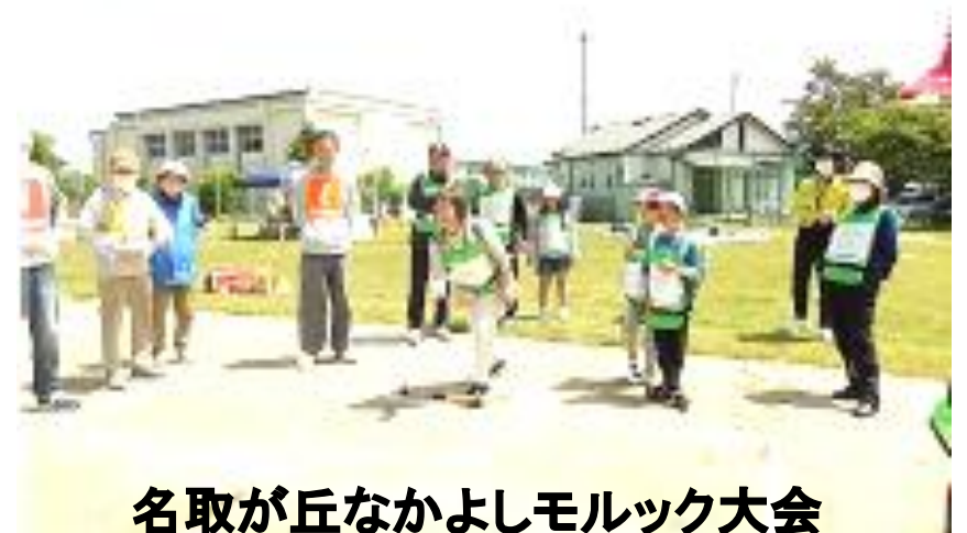
名取が丘なかよしモルック大会