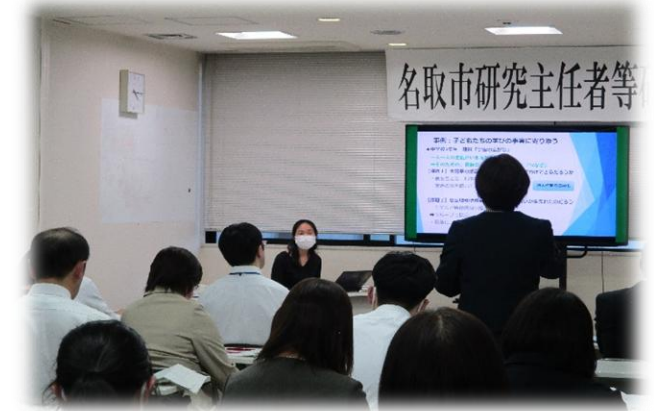
R5・研究主任者等研修会写真