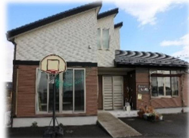
はなもも教室の外観