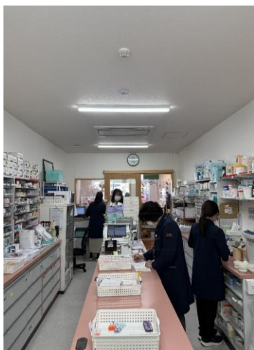
名取たこう オレンジ薬局