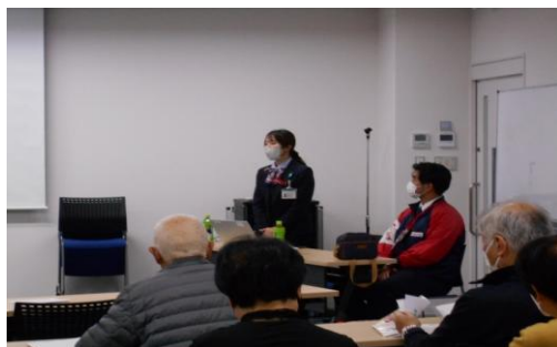
宮城中央ヤクルト販売株式会社