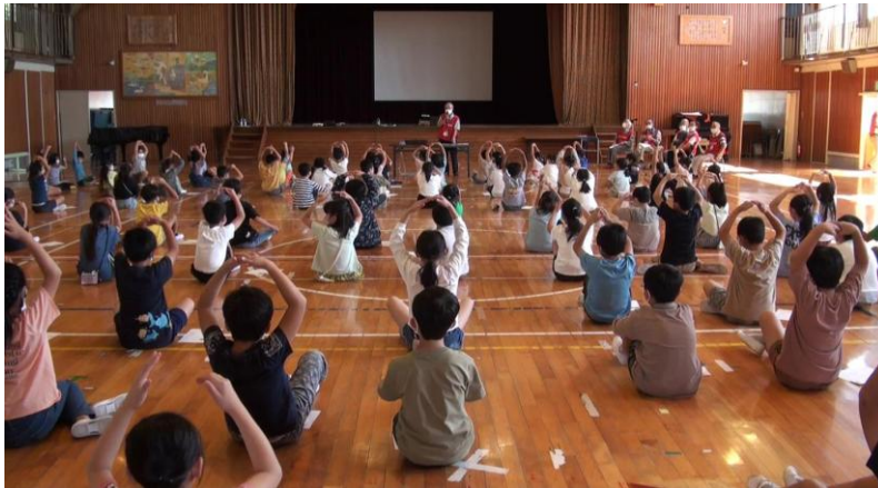
キラキラパルク増田西 (KPM) 学校での講座の様子