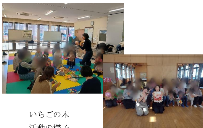
いちごの木 活動の様子