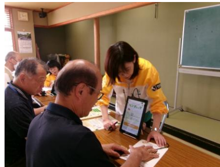
明治安田生命保険相互会社