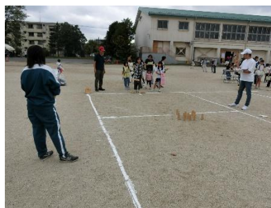
文化・スポーツ課による出前講座の様子 ～ニュースポーツ実技講習～