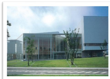
タイハクホール名取（名取市文化会館）