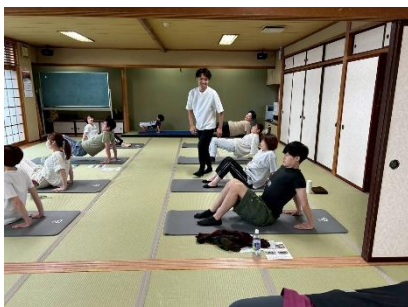
“自主企画講座”開催風景