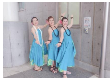
ハラウ・ユキフラ・オオリノ