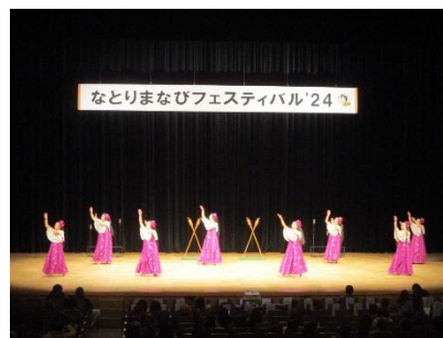
“なとりまなびフェスティバル”開催風景