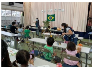
国際交流協会ともだちin名取 活動の様子