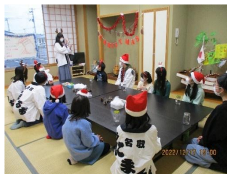
ジュニア・リーダー・サークル“あにまるず” 活動の様子