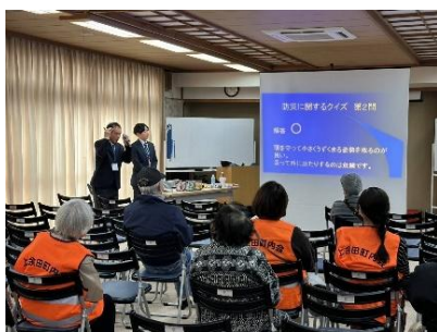
防災安全課による出前講座の様子 ～災害から身を守るために！～