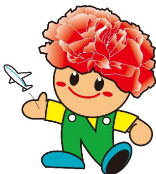
名取市マスコットキャラクター “カーナくん”