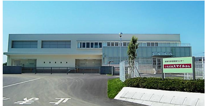
名取市学校給食センター いただきスマイルかん

そして、「笑顔で楽しく、おいしい給食を作ろう!」というセンター職員の思いも込められています。