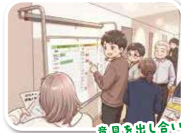
意見を出し合い 審査を進めます