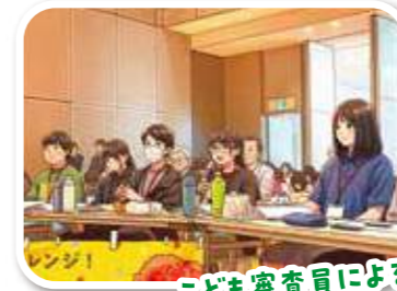
子ども審査員による 質疑のようす