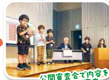
公開審査会で内容を しっかりと審査