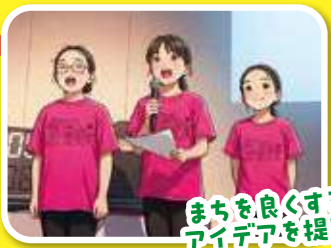
まちを良くするアイデアを提案

自分が選んだグループの活動の成果を、活動発表会で聞いたとき、グループの活動がとても素晴らしくて、応援してよかったと思った！