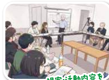
提案・活動内容を 細かくチェック