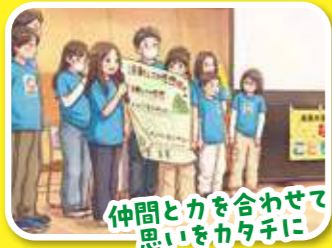
仲間と力を合わせて思いをかたちに