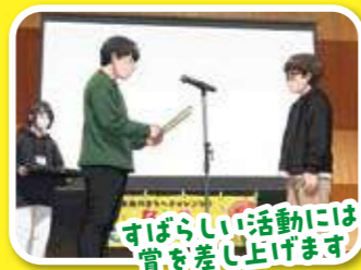
すばらしい活動には賞を差し上げます