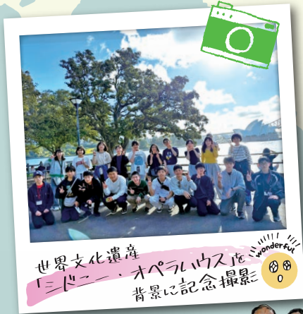
世界文化遺産「シドニー・オペラハウス」背景に記念撮影 📷