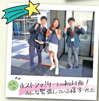
😊ホストファミリーとの初対面！みんな緊張している様子でした