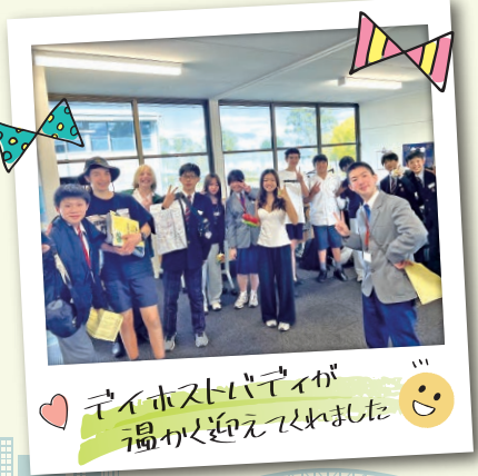
デイホストバディが温かく迎えてくれました😊