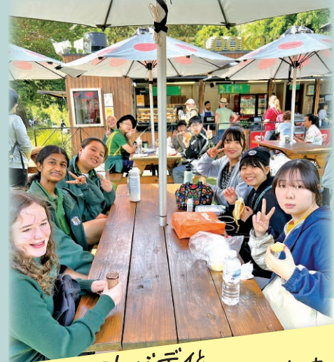
デイホストバディと動物園でランチしながら交流