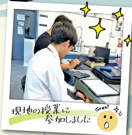
現地の授業に参加しました Great 😊