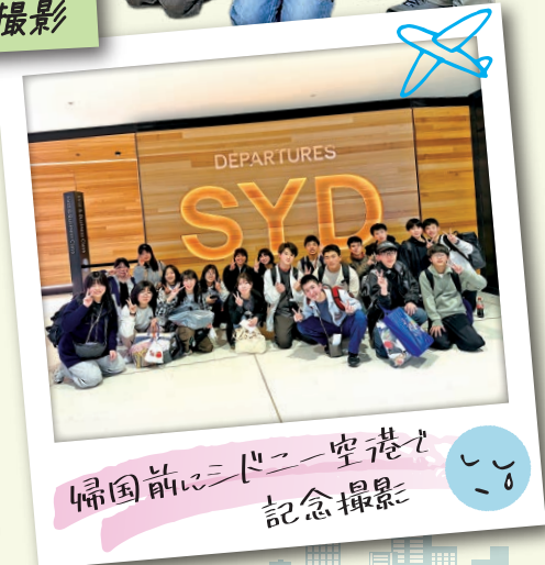
帰国前にシドニー空港で記念撮影 📷