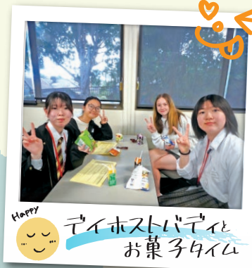
Happy 😊 テイホストバディとお菓子タイム