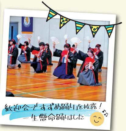
歓迎会でおすすめ踊り披露！一生懸命踊りました😊