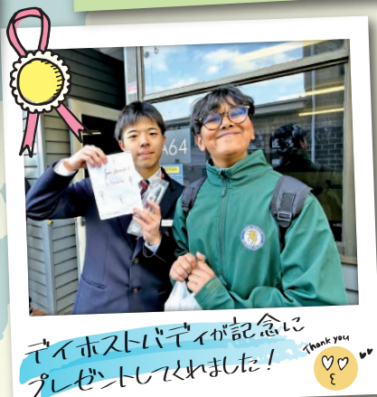
テイホストバディが記念にプレゼントくれました! Thank you 📷