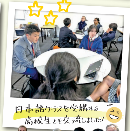
日本語クラスを受講する高校生と交流しました! 😊