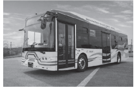
3月23日に運行が開始された大型EVバス

名取市は、令和3年10月に「ゼロカーボンシティ宣言」を行い、市民や事業者とともに脱炭素に向けた取り組みを進めています。