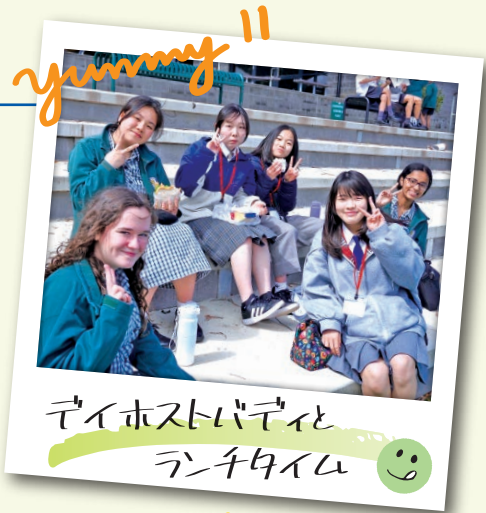
yummy!! テイホストバディとランチタイム 😊

また、3泊4日のホームステイを通して、現地の食文化や生活様式などを知り、ホストファミリーと充実した日々を過ごしました。