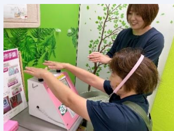
乳酸菌で内外美容