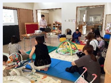
おなか花びまる教室

宮城中央ヤクルト販売株式会社の講座申込を希望する人は、生涯学習課に市HPに掲載の申込書を提出、または電話・メールでお問い合わせください。