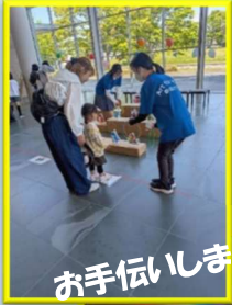
お手伝いしました

現在、中学生8名、高校生8名、 大学生1名で活動しています。 今年も「なとりこどもファンド」に チャレンジするほか、公民館を会 場に、中高生の居場所づくりも計 画中。 一緒に活動してくれるメンバーを 募集中! 問い合わせは、愛島公民館または InstagramのDMから。