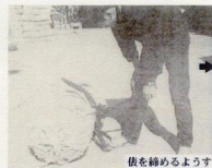
依を締めるようす