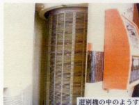
選別機の中のようす