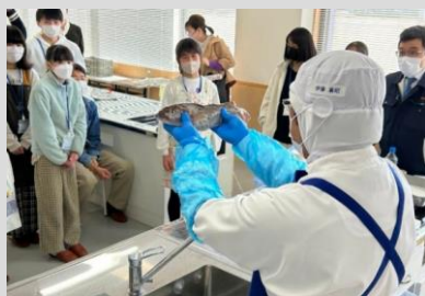
まずは魚を丸ごと捌くところからのスタート