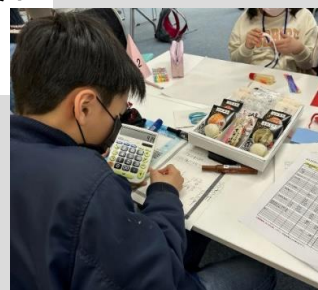
笹かまギフトづくりWS。 どんな日に、誰に向けてのギフトにするか…みんなで話し合いました。