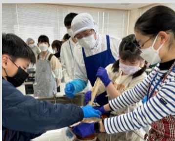
すり鉢でする作業がこれまた大変！ 塩を入れると、身が引き締まって更に力が必要です。