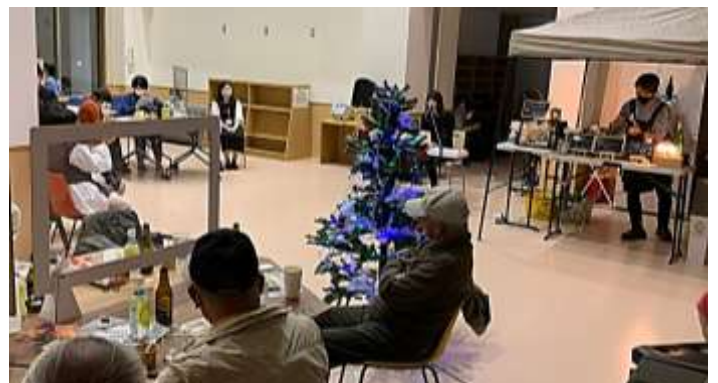
↑夜はライトアップされた館内で「Night Cafe 公民館」を開催。弾き語りなどのパフォーマンスも！（次頁）