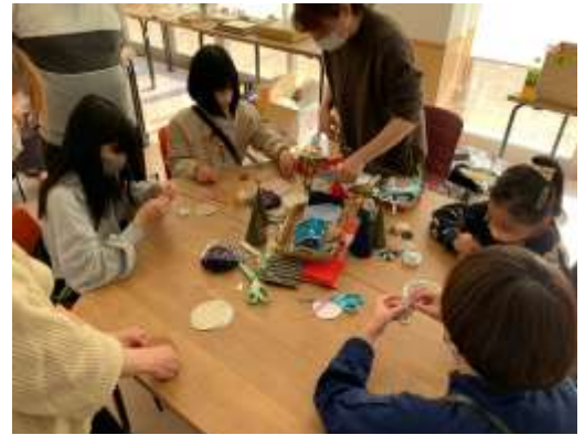
↑体験ブースは早くも満員御礼状態に