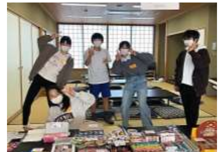
↑「駄菓子コーナー」は閑上小中学校の8年生が担当