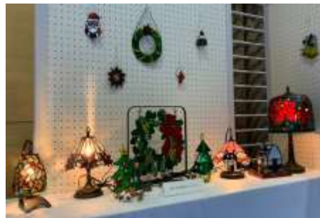
↑幻想的な灯りのスタンドグラス作品