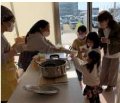
↑地元企業様ご協賛コーナー