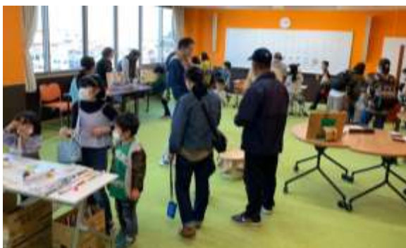
↑子ども達に大人気の「昔あそびコーナー」