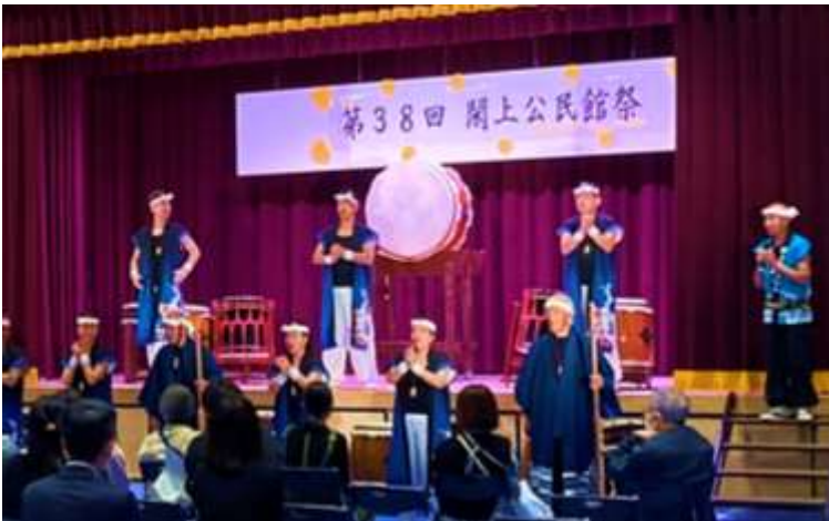
↑『閑上大漁太鼓』の勇壮なリズムで華やかに開会！

開催にあたりご協力いただきました地元企業様並びに住民の皆様に心より感謝申し上げます。