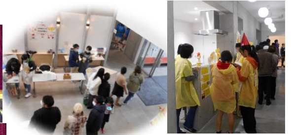
▲中学生ブース (駄菓子屋・かき氷 レモネードスタンド)