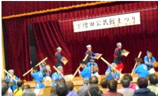
▲下増田麦搗き踊り (オープニング)

11月11日(土)第39回下増田公民館まつりが盛大に開催されました。 新公民館での初めての開催で、中学生、大学生の運営、「いろんなマルシェ」など初の試みで、1,600人以上もの方にご来場いただきました。 開催にあたりご協力いただきました実行委員の皆様、そしてご出演、ご出展くださった皆様、ご来場くださった皆様に心より感謝申し上げます。