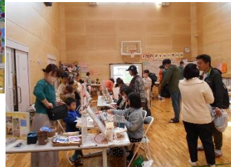
▲いろんなマルシェ