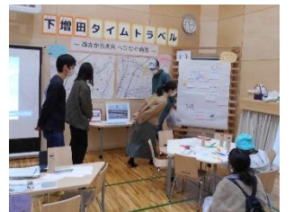
▲大学生ブース (下増田タイムトラベル)