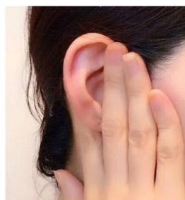
耳もみセルフケア