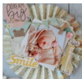
スクラップ ブックイングWS