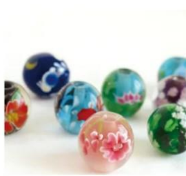
ガラスアクセサリ WS