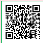
館腰公民館ホームページ

編集発行: 館腰公民館 名取市植松三丁目9-5 TEL 382-2006 FAX 382-2153