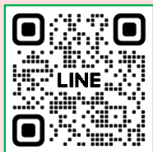
館腰公民館 LINE 公式アカウント