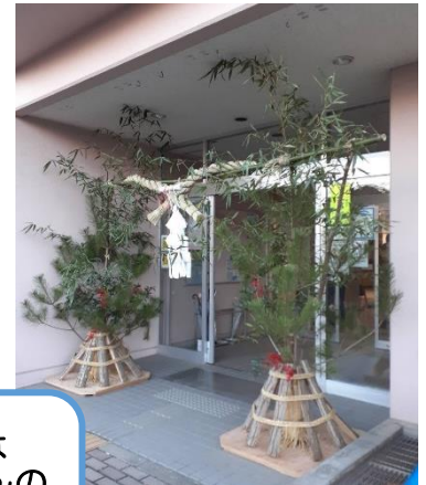
※昨年制作した 仙台門松です