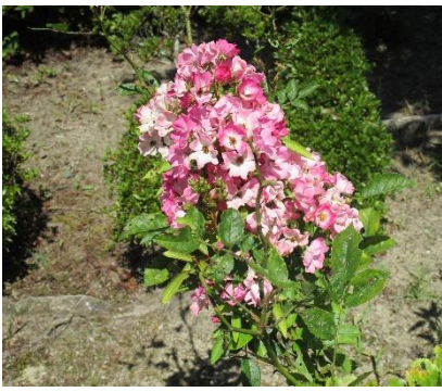
公民館入口わきに咲くバラ