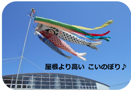
屋根より高い こいのぼり♪