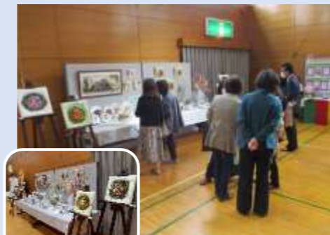
ルナ・フローラパンの花 パン粘土

◆公民館サークルの皆様による、繊細で丁寧な手作り作品が会場を華やいだ雰囲気になりました。