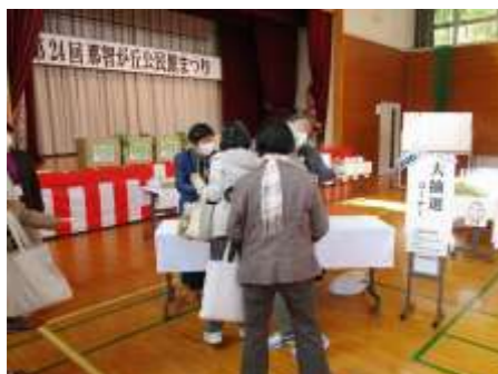
抽選コーナーの様子