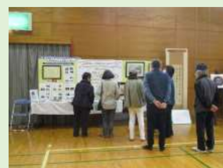
那智が丘福寿会・多士済々作品