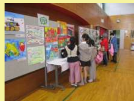
那智が丘小学校児童の絵画、工作