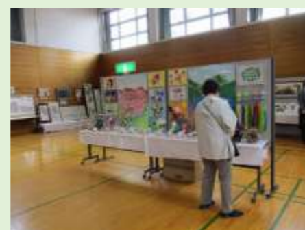
ほっとなとりなちゆる作品