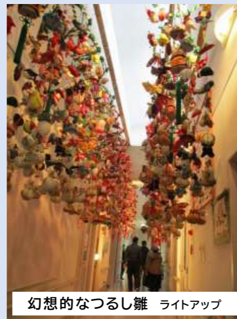
幻想的なつるし雛 ライトアップ