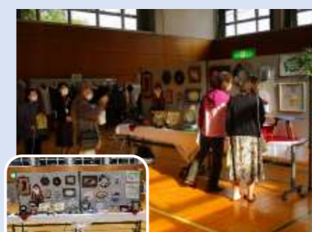
シュナーベル トールペイント作品