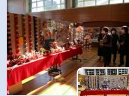
織縹会 ちりめん細工作品