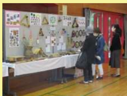
那智が丘児童センター工作・手芸