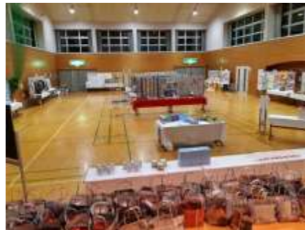
ホール展示の様子