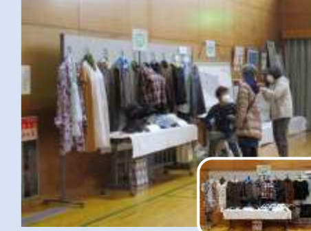
ソーイングすみれ 洋裁

◆ロビーと廊下の「なおかつフォトエッセイ」作品展示ではポストカードのプレゼントがありました