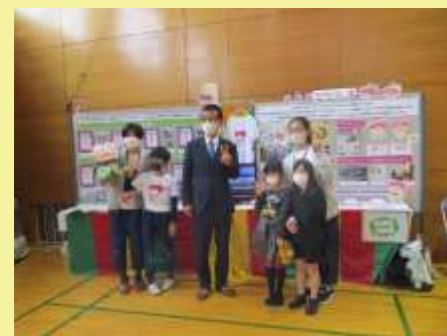
#カタクリっ子・市長とパチリ