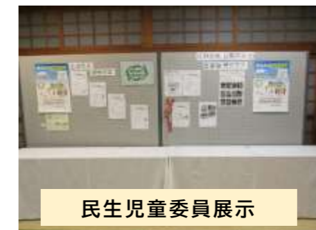
民生児童委員展示