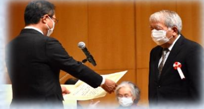
(名取市社会福祉大会の様子)