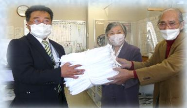
(那智が丘公民館へ寄贈の様子)

令和3年度第47回名取市社会福祉大会では、10年間の地域福祉活動「雑巾進呈：1,970枚」に対する功績に感謝状をいただきました。