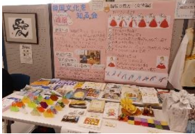
韓国文化を知る会