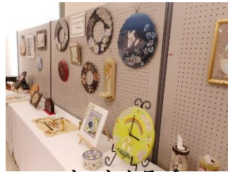
ペイントクラブ ・アナベル