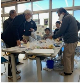
「レモンで電池を作ろう」