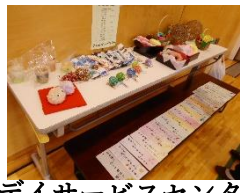
デイサービスセンター さんさん