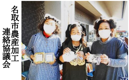
名取市農産加工 連絡協議会