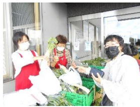
あい・らぶ ・めでしま