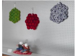
「毛糸の座布団」 「じいとばあ」