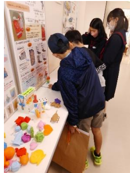
←仙台高専名取 キャンパス