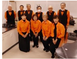
ギターアンサンブル ・ライラ