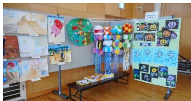
愛島小学校・愛島児童センター

愛島地区の皆様や公民館利用の皆様方に 多大なるご協力をいただき、無事公民館 まつりを開催することができました。 誠にありがとうございます。心より感謝 申し上げます。