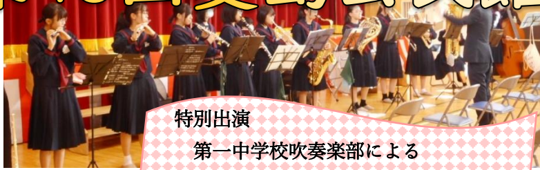
特別出演 第一中学校吹奏楽部による ファンファーレでスタート!