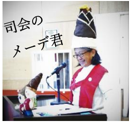
司会の メーデー君