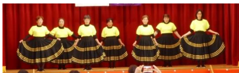
愛島レクダンス愛好会