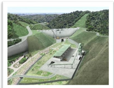
(※2)コンクリートプラントのイメージ