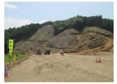
(※1)ダム仮設広場の工事状況