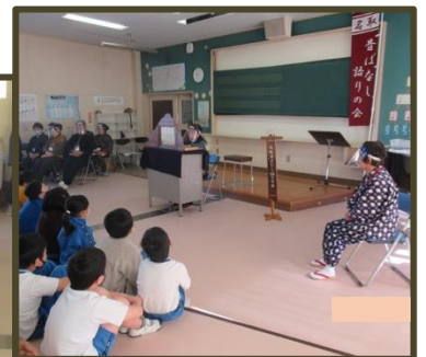
◀ 真剣に話を聞く子どもたち