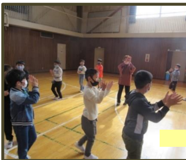
みんな踊りが大好き！▶