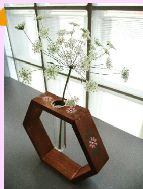
トールペイントの可愛らしさが白いお花を引き立てていますね♪