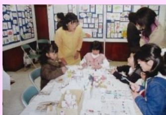
トールペイント体験の様子