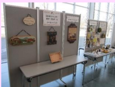
令和2年度なとりまなびフェスティバルの作品展示