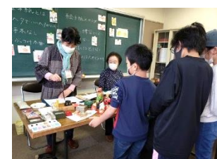
サークルによる「絵手紙で年賀状を書こう」