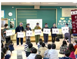
地域団体による地域学習の補助