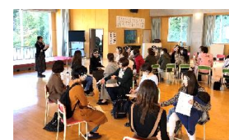
家庭教育支援チームによる 新入学家庭教育講座

活動に参加することが「なとりっこ」の豊かな学び・地域づくり・一人一人の生きがいにつながります。