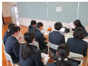
キャリア教育への支援