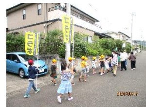
子ども放課後見まわり隊