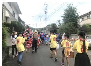
子供たちが夏祭りへ参画