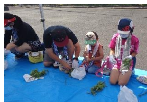
団体による枝豆もぎとり体験会