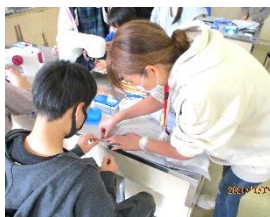
ミシン学習の補助