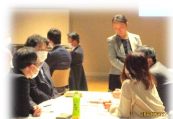
市主催の研修会（2月）

この他にも、登下校の見守り・給食の補助・校庭や花壇の整備・校外学習の見守り・プール学習の見守り・手話指導・サマースクール支援・行事での駐車場誘導・地域行事への参加・ボランティア研修会など、既存の活動から新しい活動まで地域に合わせた活動を工夫して行っています。