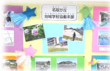
不二が丘小：協働活動掲示板