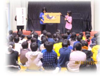
那智が丘小：おはなし会