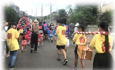
みどり台中：夏祭りのお手伝い