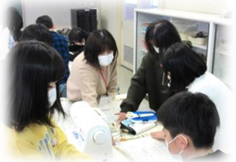
下増田小：ミシンボランティア